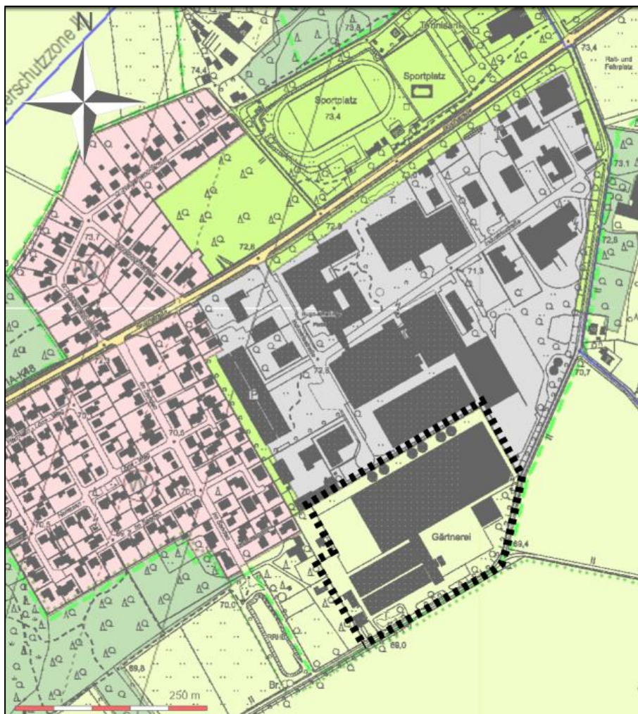
Abbildung 1: Darstellung des Änderungsbereiches (FNP)

Das ca. 5,03 ha große Plangebiet befindet sich im Westen des Ortsteils Lette und grenzt südlich an das Betriebsgelände von Ernsting's family. Der Änderungsbereich ist der folgenden Abbildung zu entnehmen.