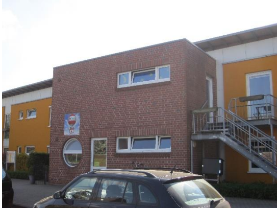
Nachbargebäude der Kreuzschule