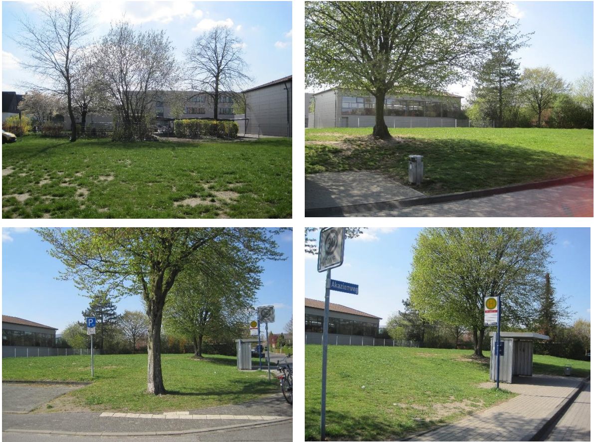
Abbildung 3: Fotos Plangebiet