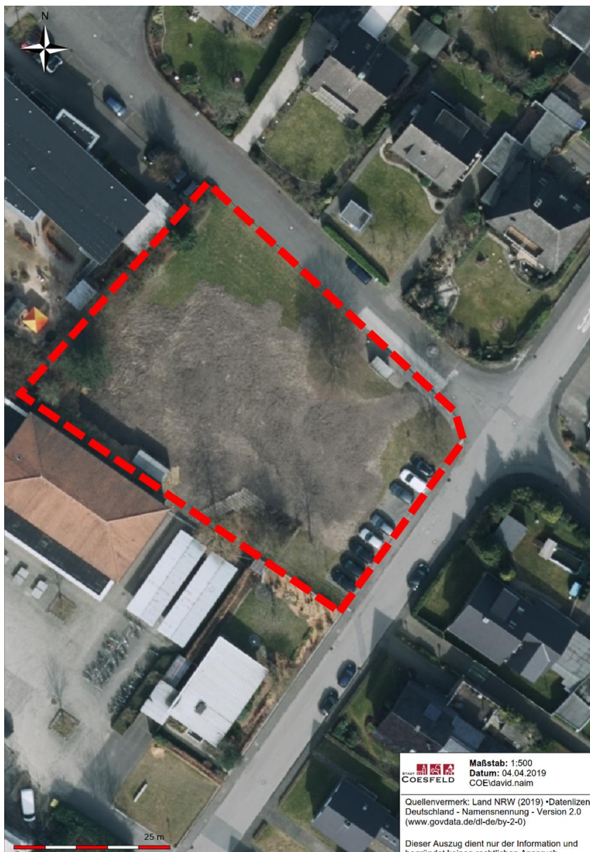
Abbildung 2: Luftbild Plangebiet (Abgrenzung B-Plan Nr. 12a siehe rote Linie)

Im Rahmen des Bebauungsplanverfahrens wurde eine Bestandsaufnahme der Bebauung im und angrenzend zum Plangebiet durchgeführt. Die Erfassung erfolgte durch mehrere Ortsbegehungen und mittels Auswertung von Bauakten bzw. Baugenehmigungen. Mit Hilfe dieser Bestandserfassung ist es möglich, einen B-Plan zu entwickeln, der die Nutzungen und Bebaustrukturen im Bestand berücksichtigt. Zusammenfassend lässt sich die derzeitige Situation im Plangebiet wie folgt beschreiben.