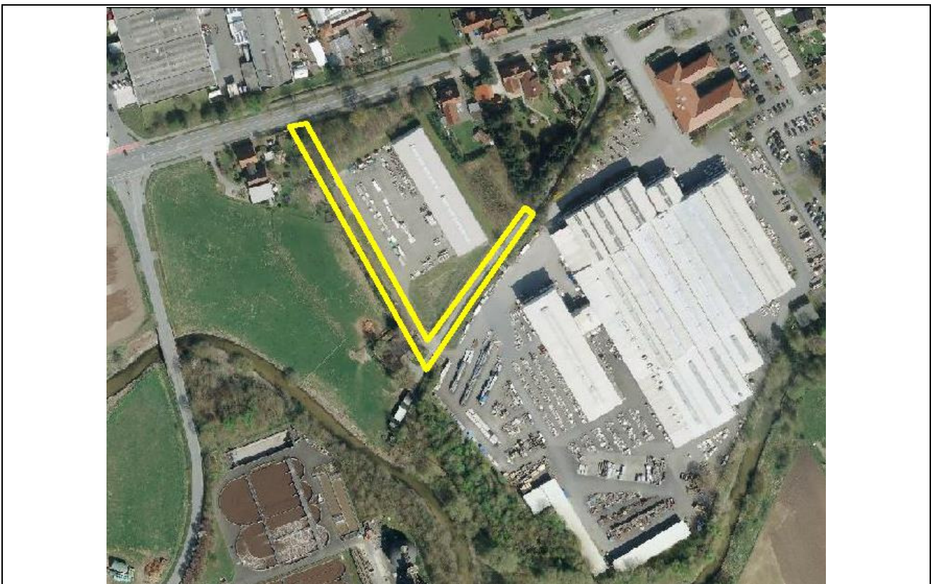
Abb. 5: Änderungsbereich B-Plan "Rebrügge"

Für das Bauvorhaben soll im Westen eine neue Zuwegung errichtet werden, hierzu muss die vorhandene baumheckenartige Struktur, die das nördliche Betriebsgelände nach Westen hin sichtsverschattet, gerodet und in eine neue Zuwegung umgewandelt werden. Es handelt sich um einen überwiegenden strauchartigen Bewuchs, der auch einige Überhälter aufweist, das Alter der ~6 m hohen Hecke ist mit 10- 20 Jahren anzugeben. Im Norden mündet die Hecke in einen mehr flächigen Gehölzbewuchs mittelalter Laubbäume ein, der ebenfalls z.T. für die neue Einmündung in die Borkener Straße beansprucht wird.