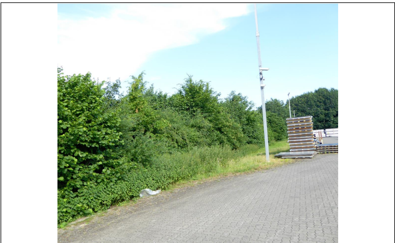
Abb. 4: überplante Hecke im Westen des nördlichen Betriebsgeländes