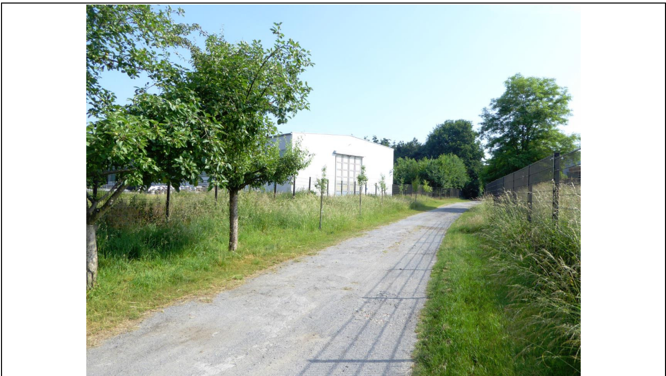
Abb. 3: alter Wirtschaftsweg "Rebrügge" - teilgeschottert mit Banketten und einzelnen Obstbäumen