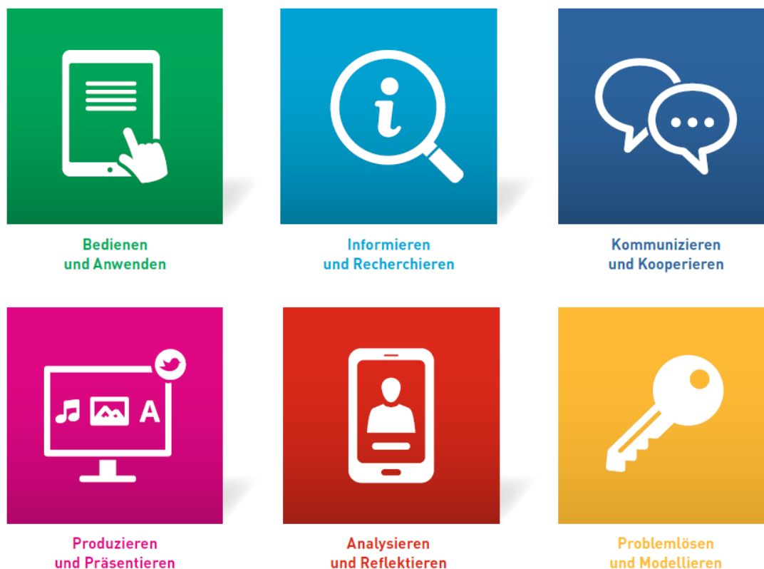
Abbildung 1: Übersicht Medienkompetenzrahmen NRW (ebd.: 6)

Kompetenzbereiche mit insgesamt 24 Teilkompetenzen zielen dabei in ihrer Gesamtheit nicht nur auf eine systematische Medienbildung entlang der gesamten Bildungskette. Sie beziehen schulische wie außerschulische Lernorte ein und bilden die Leitlinie für die anstehende schrittweise Überarbeitung aller Kernlehrpläne für die Unterrichtsfächer.“ (ebd.: 5)