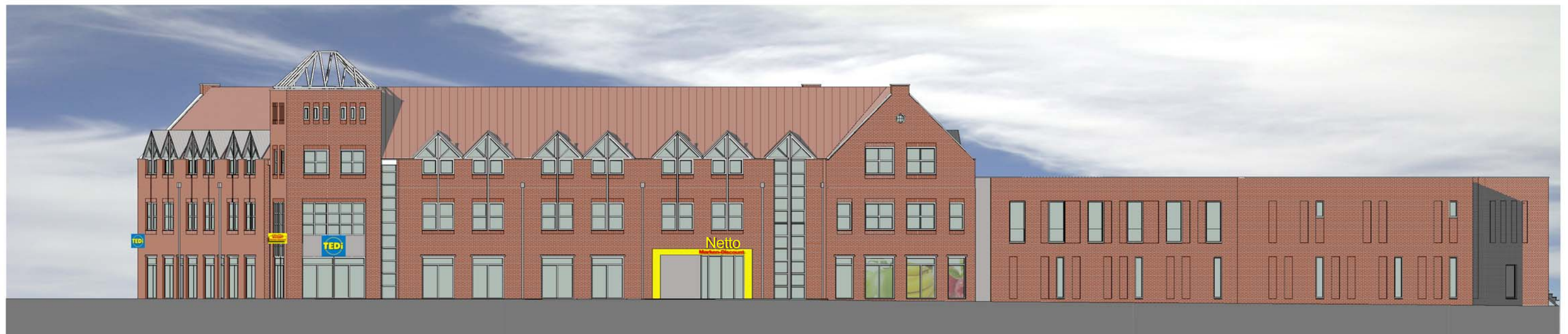
ANSICHT NORD/OST POSTSTRASSE