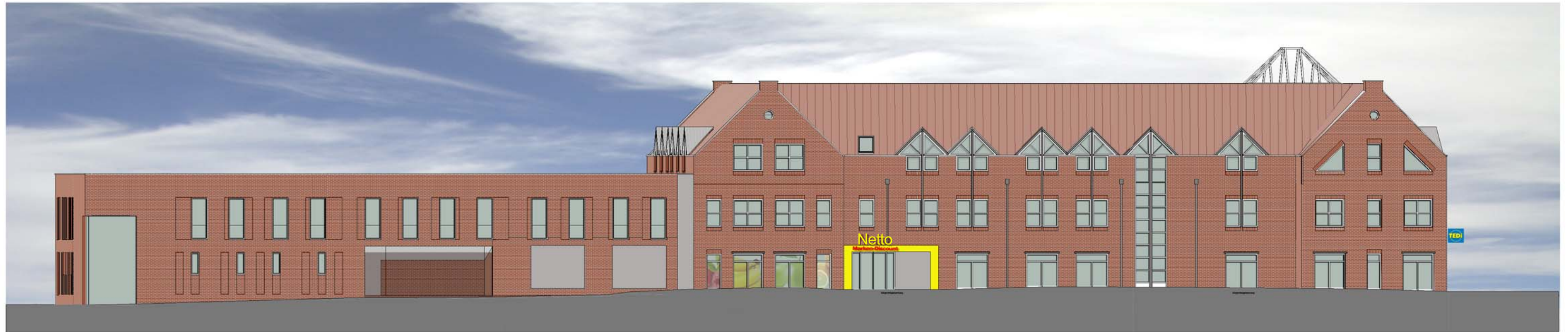
ANSICHT SÜD/WEST DAVIDSTRASSE