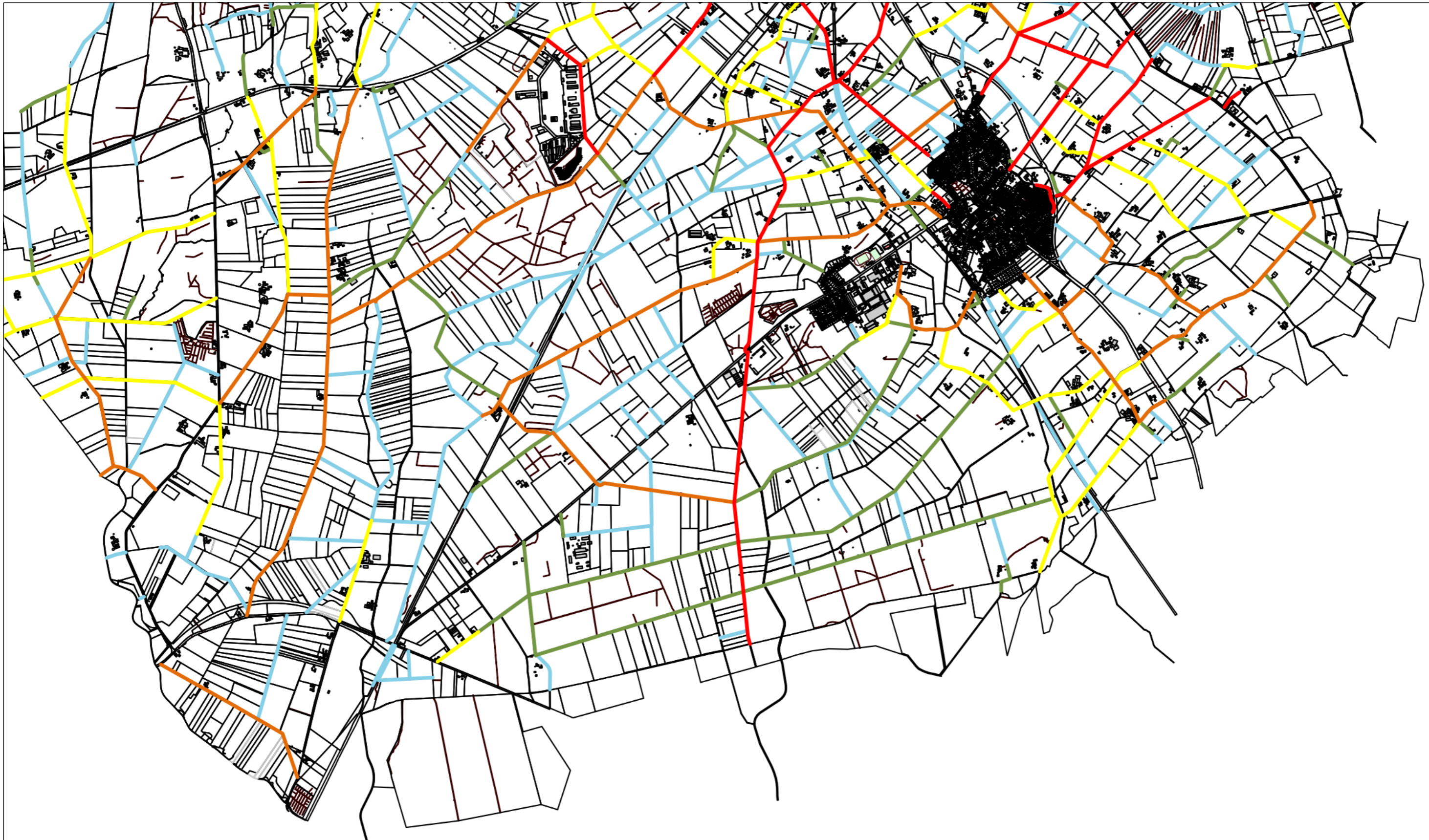
Lageplan Wegekonzept südliches Stadtgebiet