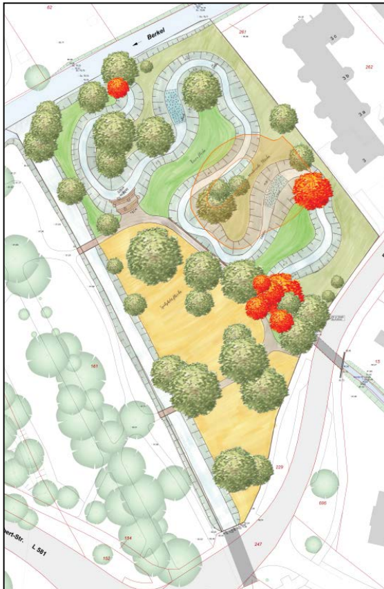
Variante 1 – Honigbach, große Rasen- & Spielplatzfläche