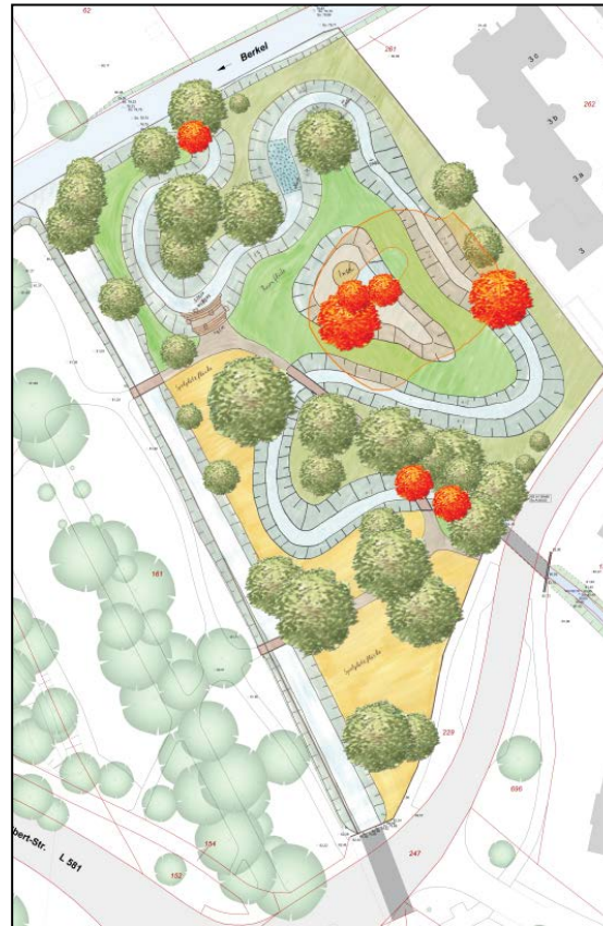
Variante 2 – Honigbach, kleiner Ententeich & Spielplatzfläche