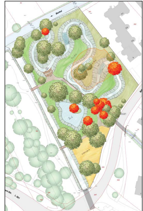
Variante 3 – Honigbach, Rasenfläche & Ententeich