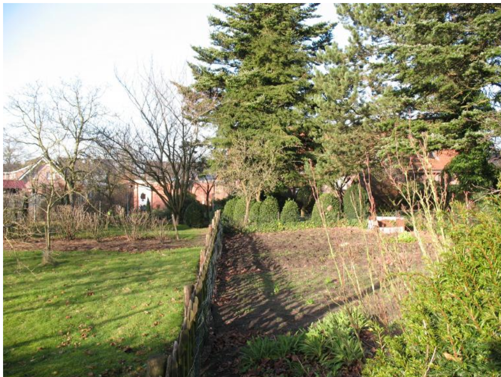
Die Gärten sind vielfältig strukturiert. Es gibt aber keine ungewöhnlich alten Bäume mit Höhlungen für Fledermäuse oder Horsten von Greifvögeln.