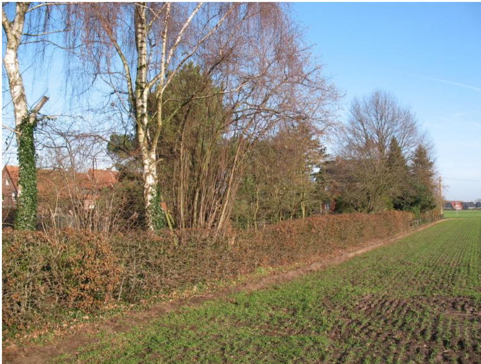
Im Bereich Meddingheide sind zwei bebaute Grundstücke mit rückliegenden großen Gärten einbezogen. Hier wurde der Baumbestand eingesehen.