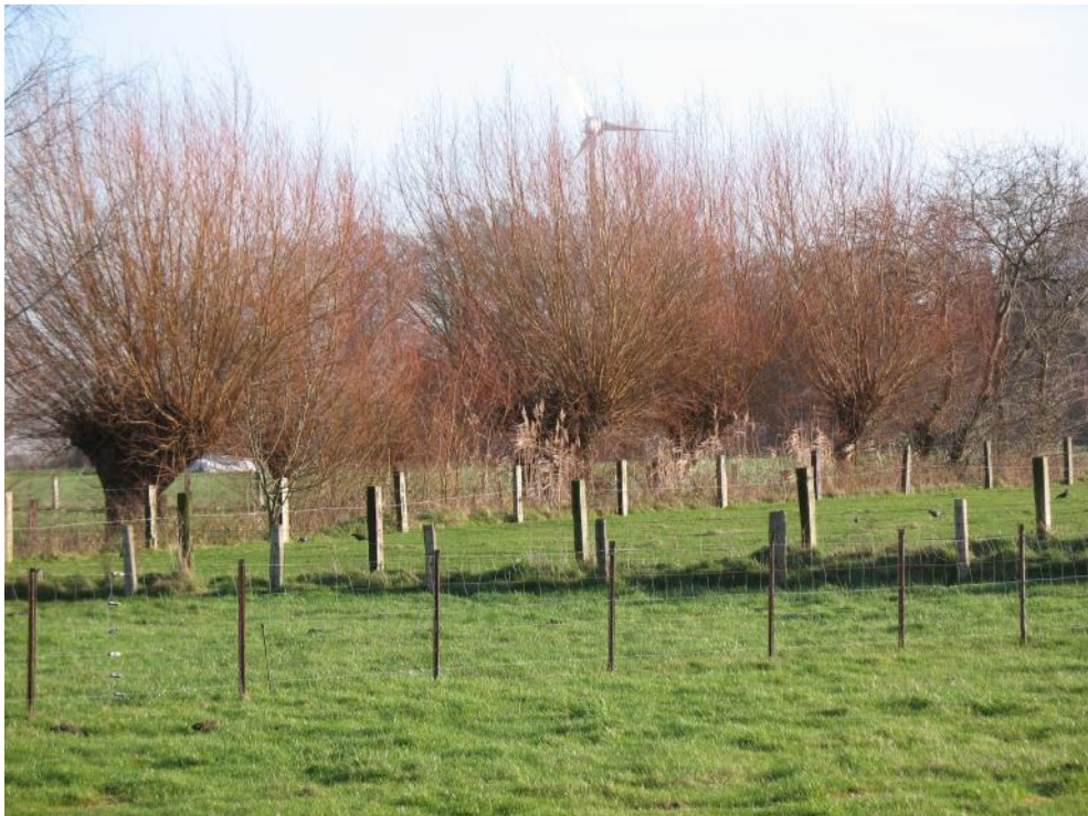
Diese Landschaft eignet sich als Steinkauz-Revier. Ob in den Kopfweiden ein Brutplatz existiert, wäre erst zur Balzzeit festzustellen.