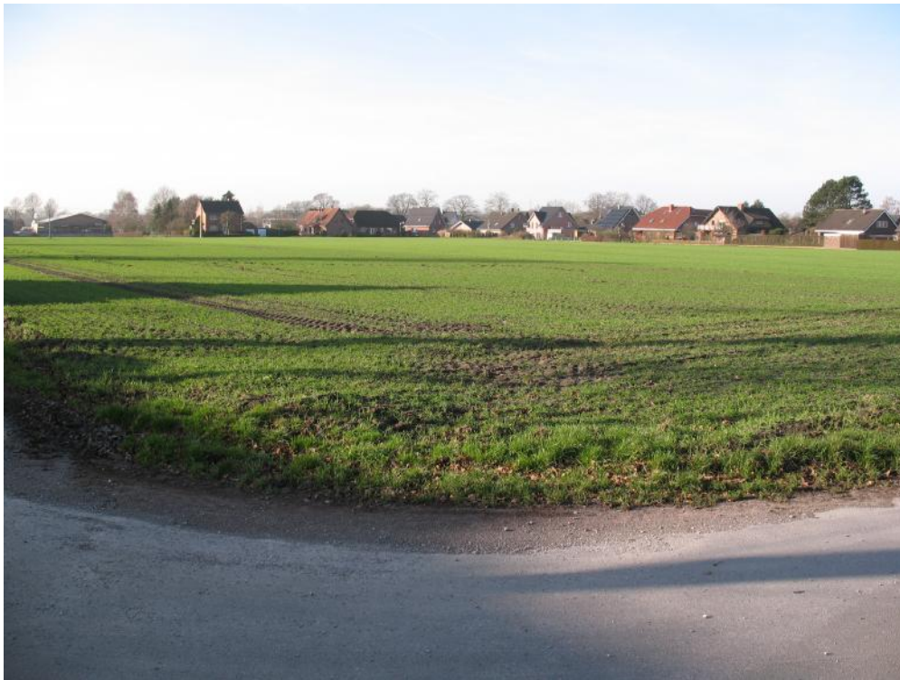
Das Bebauungsplangebiet erstreckt sich südlich des Peilsweges vor dem Ortsrand bis zum nächsten Feldweg.