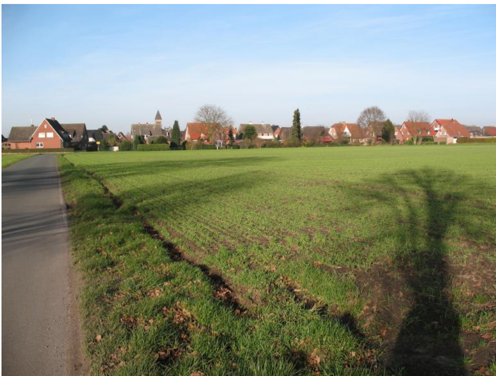
Der Teil zwischen Peilsweg (links) und Coesfelder Straße (oberes Bild) wird aber noch nicht vom Bebauungsplan Nr. 137 „Meddingheide“ erfasst.