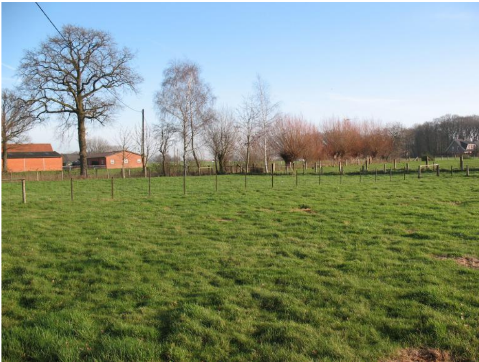
Außerhalb des Plangebietes grenzen weitläufige Grünlandflächen an. Dort gibt es neben einigen Solitärbäumen auch eine Kopfweiden-Reihe.