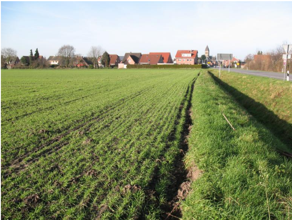
Am südlichen Ortseingang von Lette soll im Rahmen der 73. Änderung des FNP ein Wohnbaugebiet planerisch vorbereitet werden. (Fotos 28.12.2015)