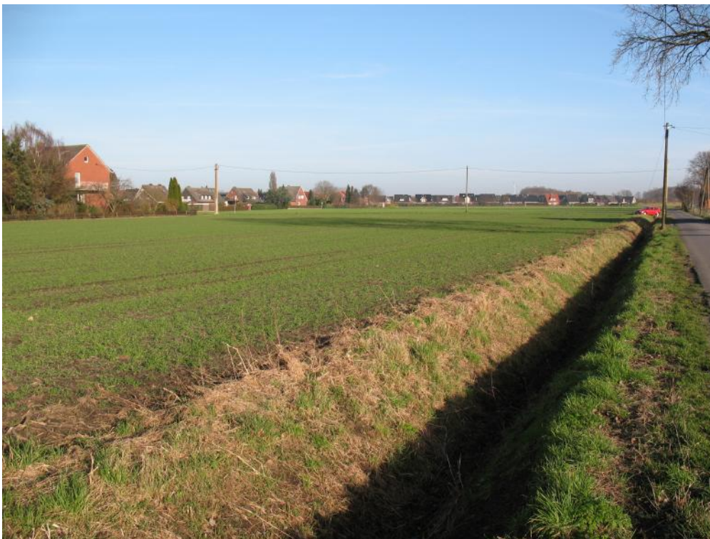
Das Gesamtgebiet vom Bereich Meddingheide (vorne) bis zur Coesfelder Straße (ganz hinten) umfasst etwa 7 ha. Es sind hauptsächlich Ackerflächen.