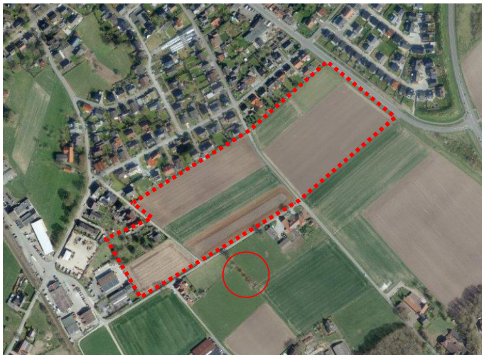
Das Untersuchungsgebiet schließt fast nur Äcker und einen kleinen Gartenbereich ein. Markiert sind benachbarte Kopfwiden. Maßstab ca. 1 : 6.000.