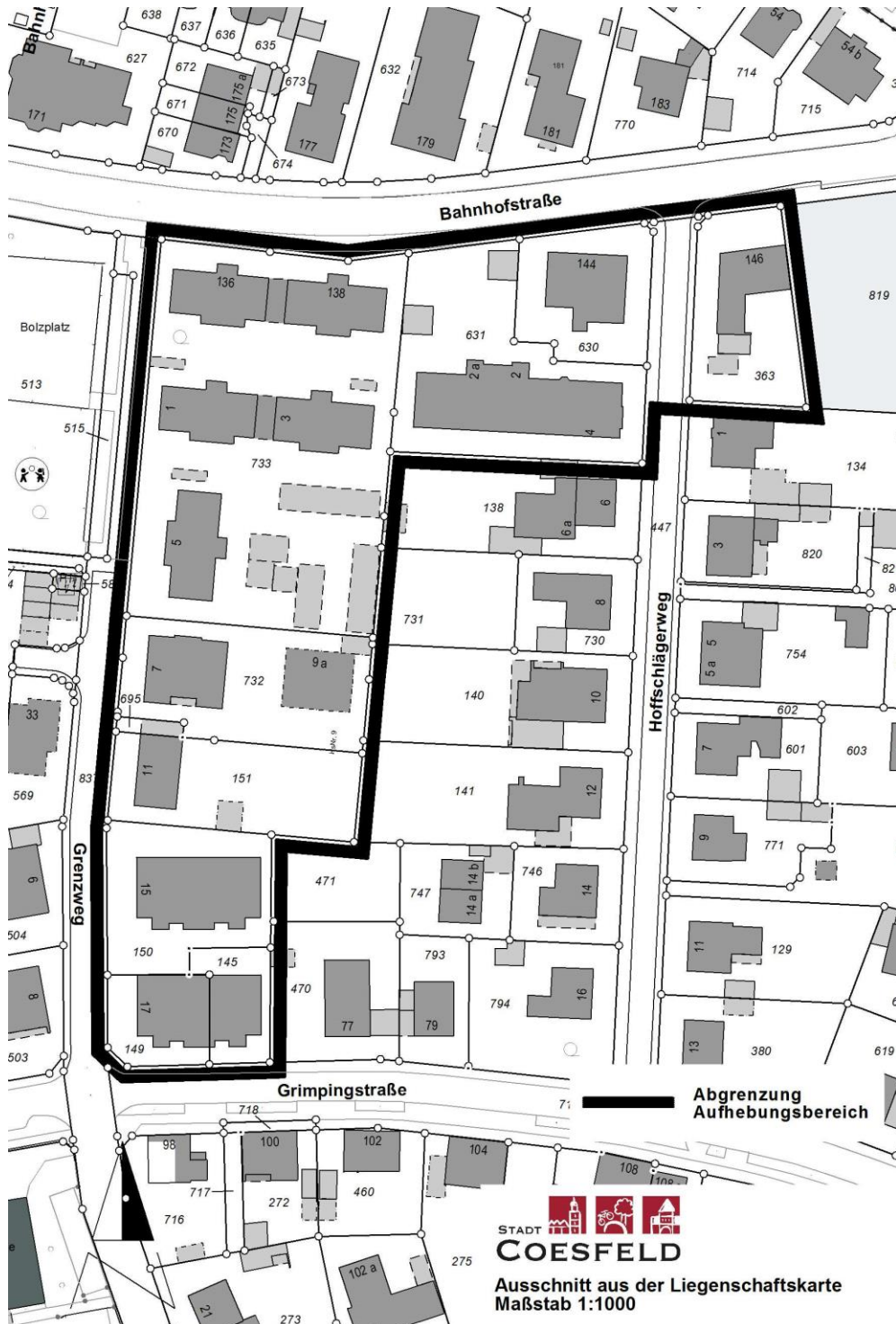
Abbildung 1: Räumlicher Geltungsbereich der Aufhebung (ohne Maßstab)

Die genaue Abgrenzung des Geltungsbereichs der Aufhebung ist aus dem nachfolgenden Übersichtsplan (siehe Abbildung 1) ersichtlich.