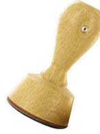
A-Stempel für die Berke|STADT Coesfeld 19. März 2015