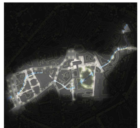
Beleuchtungsplan: Planungsstand Dezember 2014