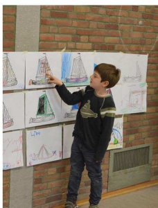
Kinder- und Jugendworkshop - Mai 2015