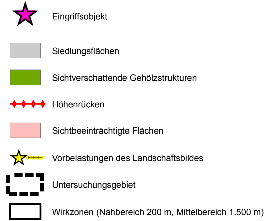
Karte 1: Sichtbarkeitsanalyse Landschaftsbild