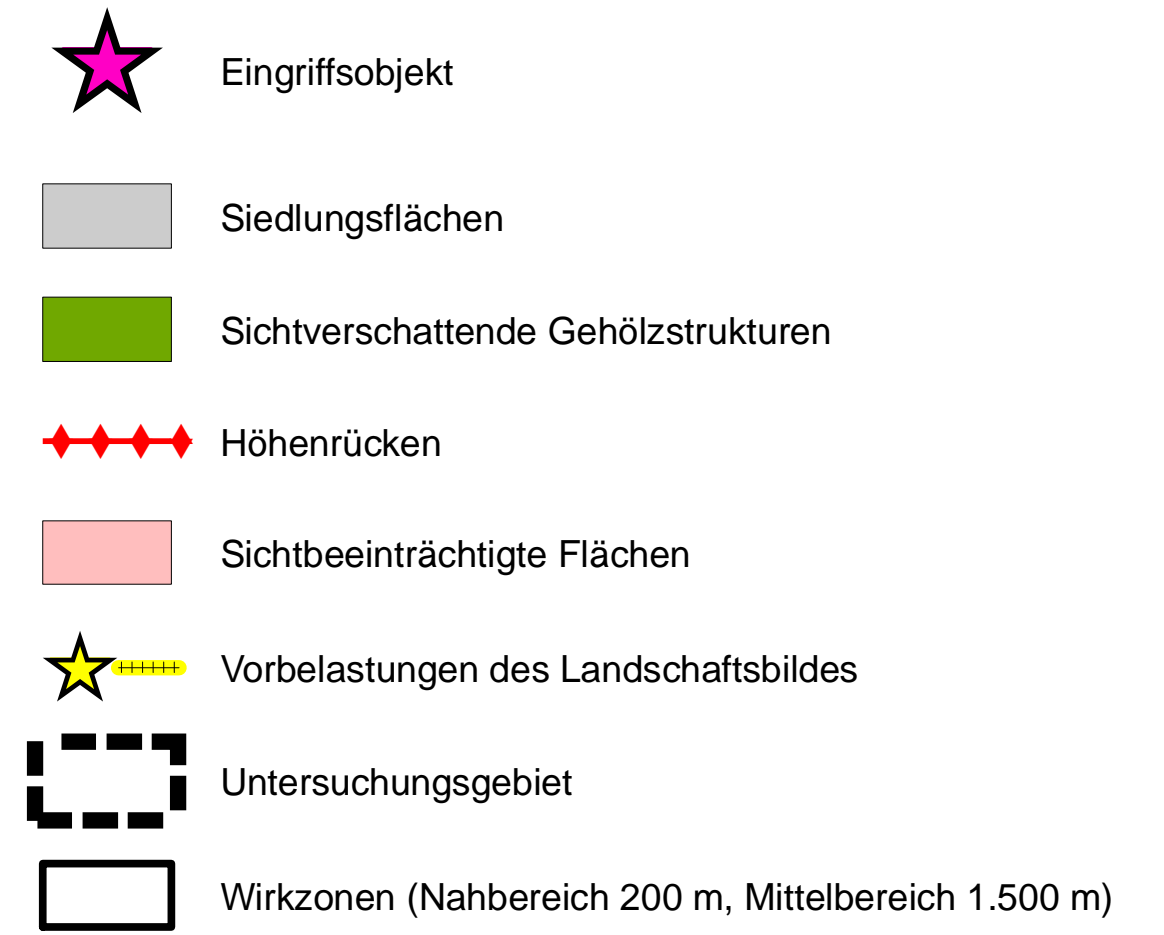
Karte 1: Sichtbarkeitsanalyse Landschaftsbild