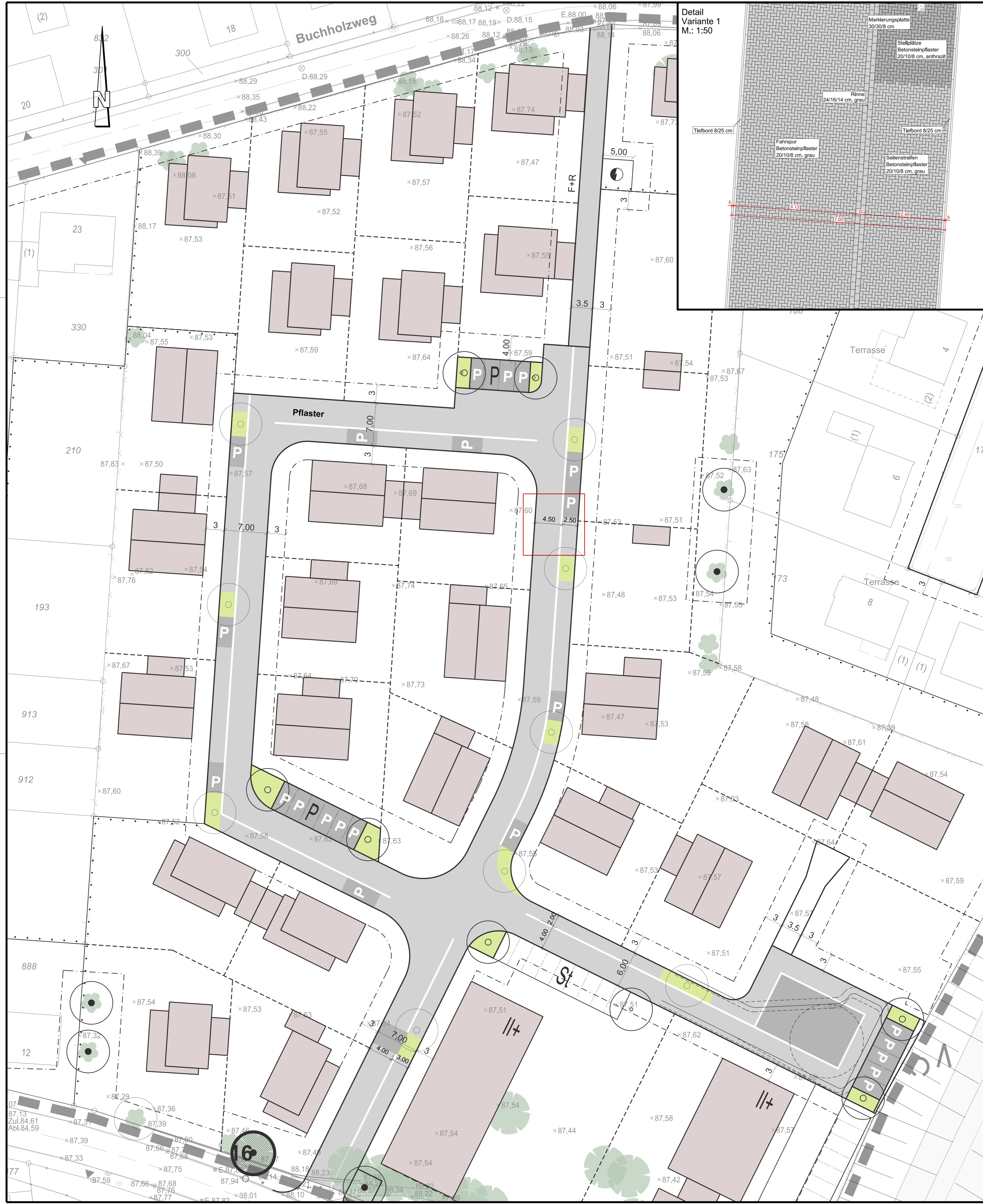
Detail Variante 1 M.: 1:50