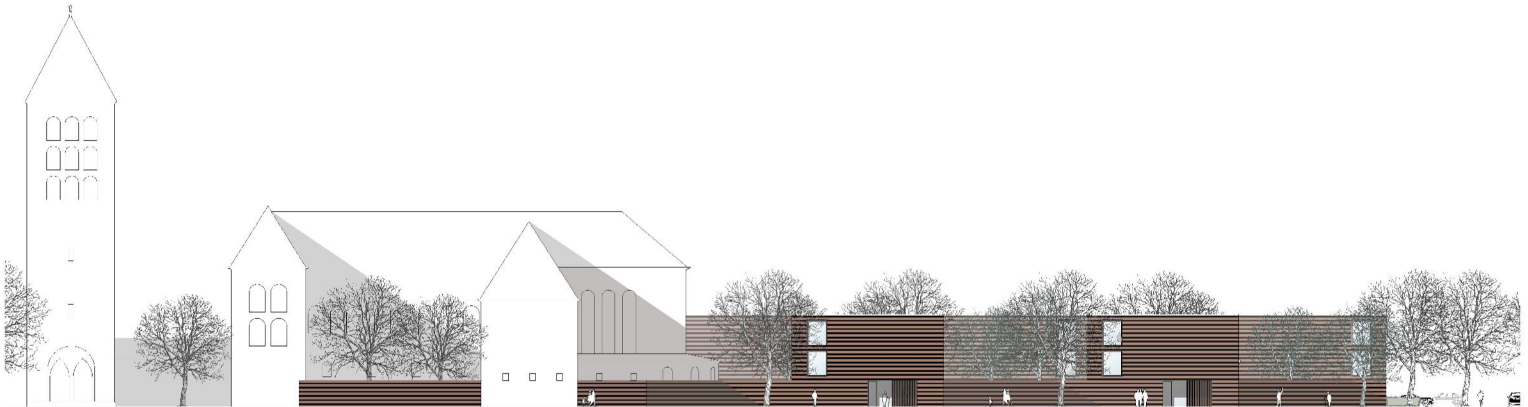
Ansicht Süd M 1:200