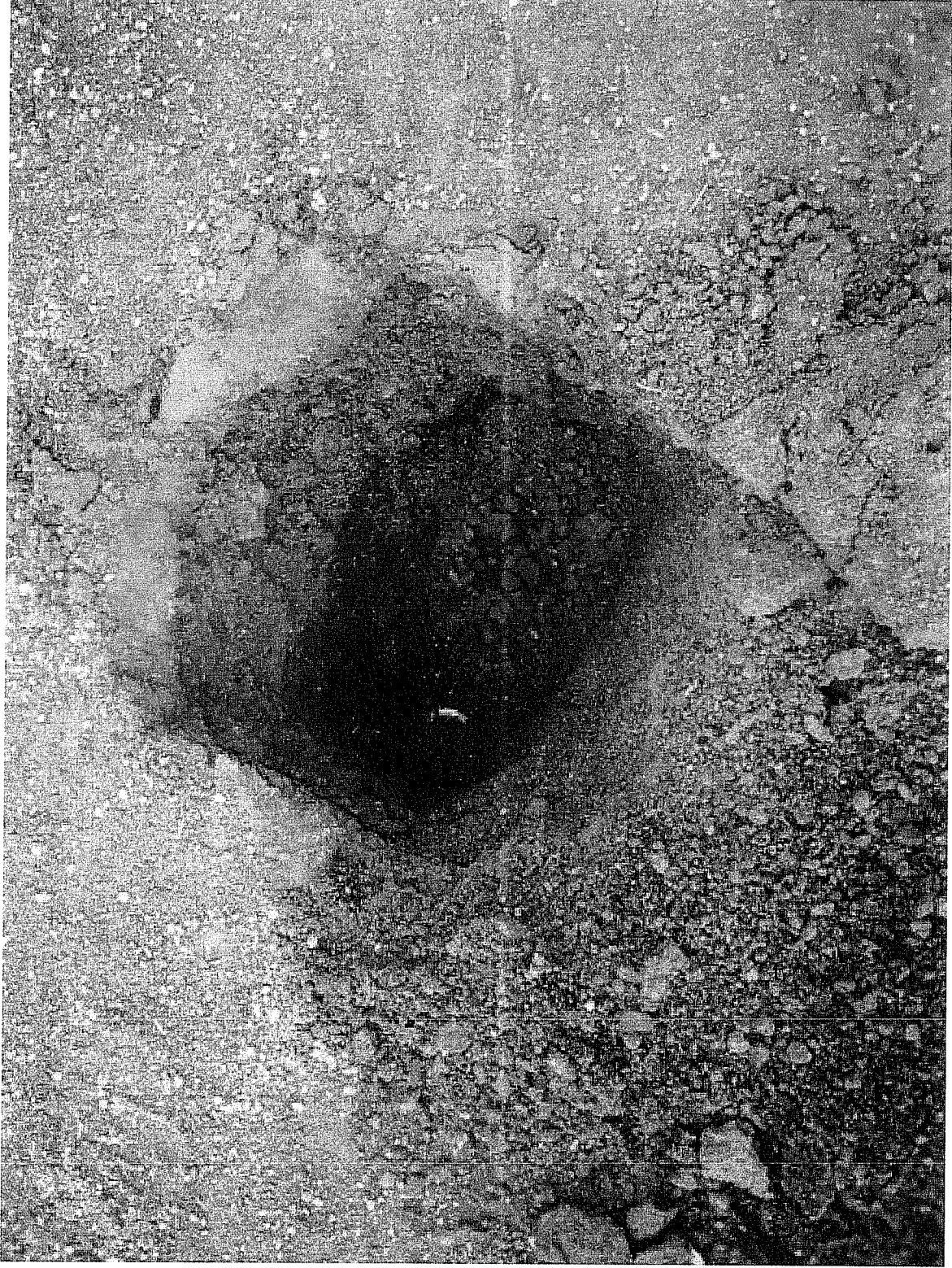
Sportplatz Lette 04.09.08