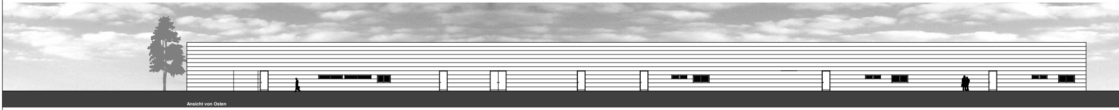
Ansicht von Osten