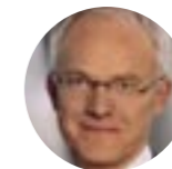
Jürgen Rüttgers Ministerpräsident des Landes Nordrhein-Westfalen Schirmherr der Stiftung Partner für Schule NRW

Als Schirmherr der Stiftung Partner für Schule NRW möchte ich weitere Unternehmen auffordern: Folgen auch Sie dem Beispiel unserer Partner und engagieren Sie sich für die Kinder und Jugendlichen in Nordrhein-Westfalen. Damit leisten Sie einen wichtigen Beitrag für die Zukunft unseres Landes.