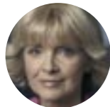
Barbara Sommer Ministerin für Schule und Weiterbildung des Landes Nordrhein-Westfalen

Meine Bitte an Schulen und Unternehmen: Nutzen Sie die Stiftung zum Wohle der Schülerinnen und Schüler!