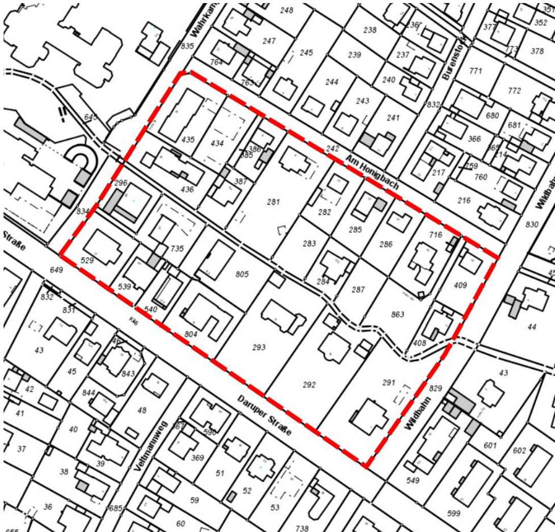
Auszug Liegenschaftskarte (Geltungsbereich des Bebauungsplans ist hier rot hervorgehoben), © Kreis Coesfeld (2021) Datenlizenz Deutschland – Version 2.0 ( www.govdata.de/dl-de/by-2-0 )

Der Geltungsbereich des Bebauungsplans Nr. 165 „Wohngebiet zwischen Daruper Straße / Am Honigbach“ befindet sich süd-östlich des Coesfelder Stadtkerns und liegt zwischen dem Amtsgericht und der Kolping-Bildungsstätte. Der Geltungsbereich wird wie folgt definiert: