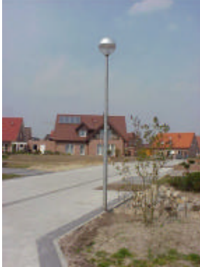
„Mastaufsatzleuchte in Kugelform“ (Beschreibung, s. Ausbaumerkmale)