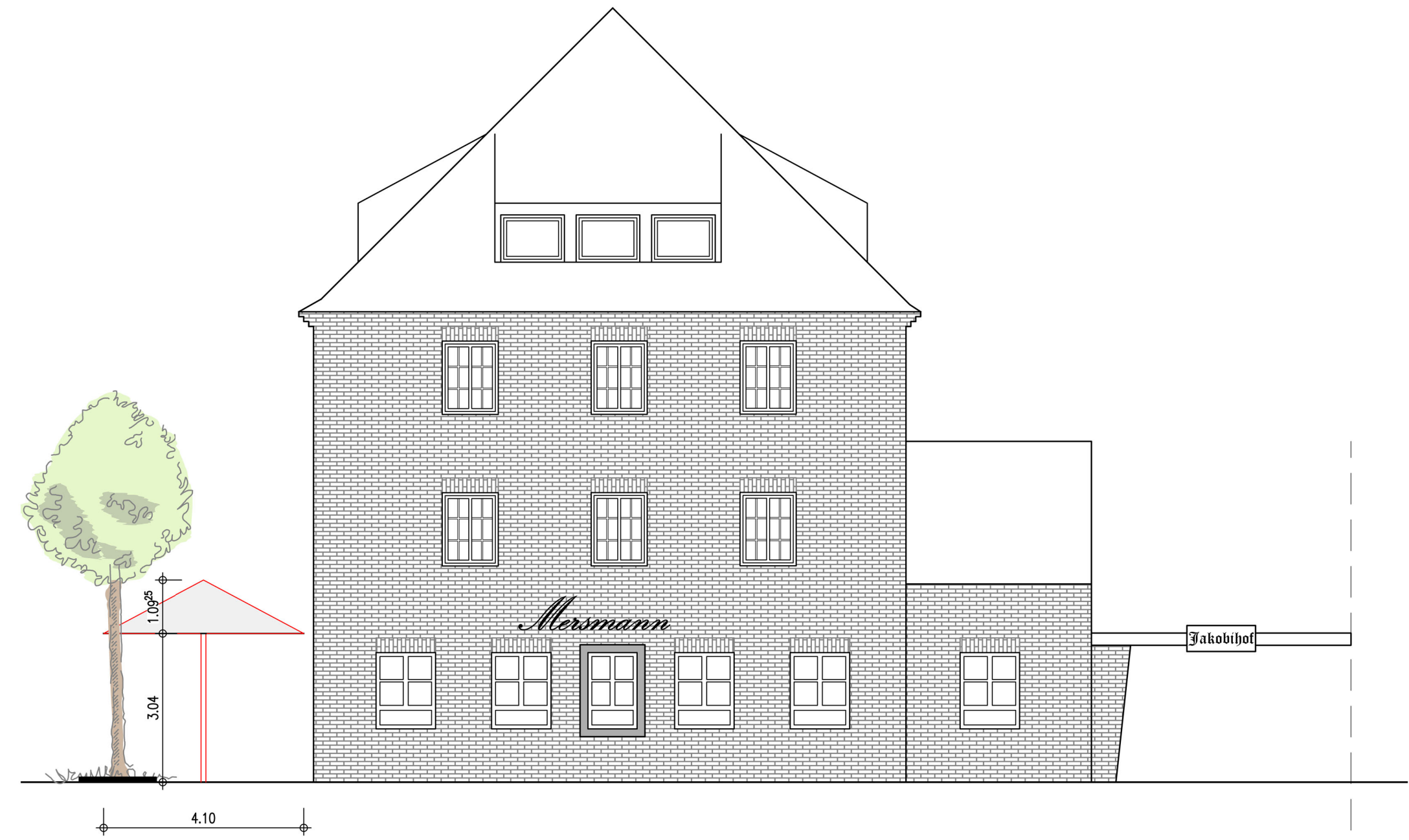
ansicht hinter strasse