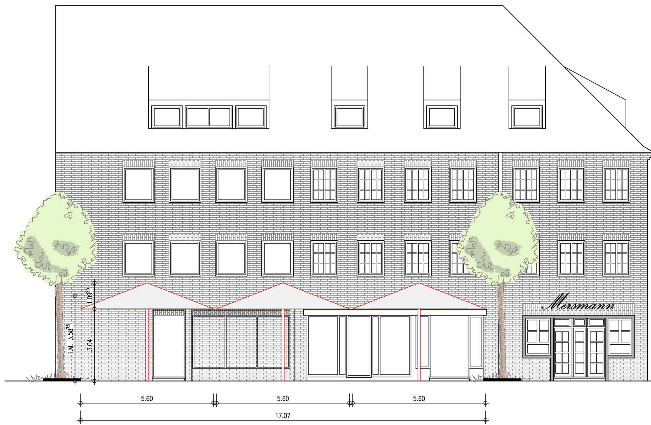
ansicht letter strasse