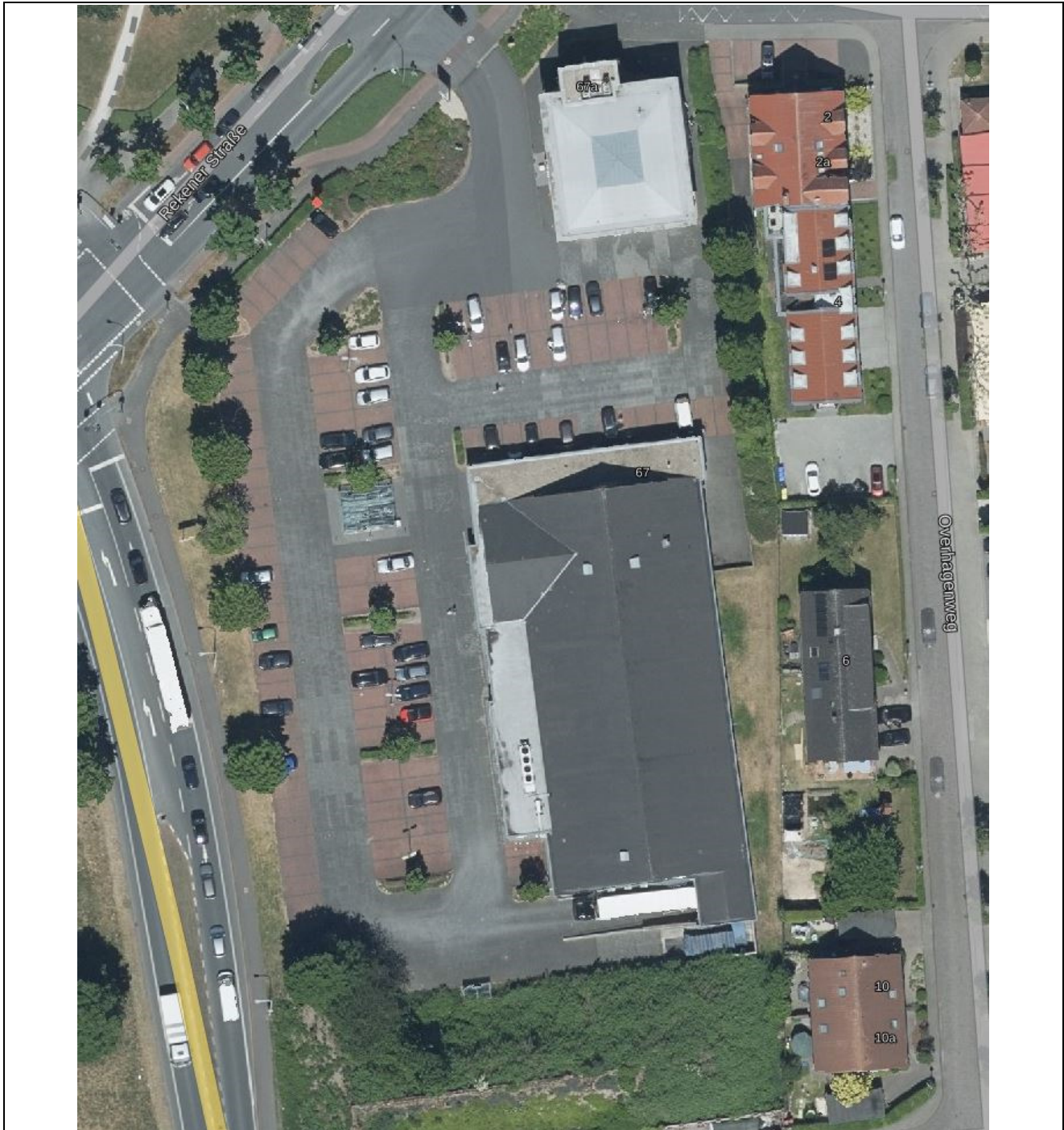
Abb. 2: Erweiterung Lidl-Fachmarkt - Lageplan

Das Lidl-Fachmarkt liegt inmitten von Coesfeld im Winkel zwischen der Rekener Straße im Nordwesten und dem Overhagenweg im Osten und dem Konrad-Adenauer-Ring im Westen.