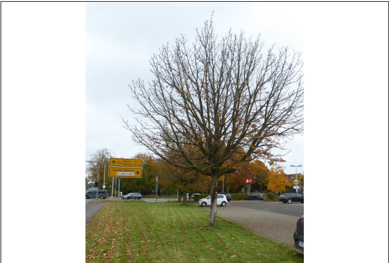
Abb. 3: markante Rosskastanien entlang des Konrad-Adenauer-Rings

Keiner dieser Bäume weist eine artenschutzfachliche Relevanz auf. Baumhöhlen oder Horste sind in keinem dieser Bäume vorhanden. Diese Gehölze bieten keinen planungsrelevanten Arten einen geeigneten Lebensraum.