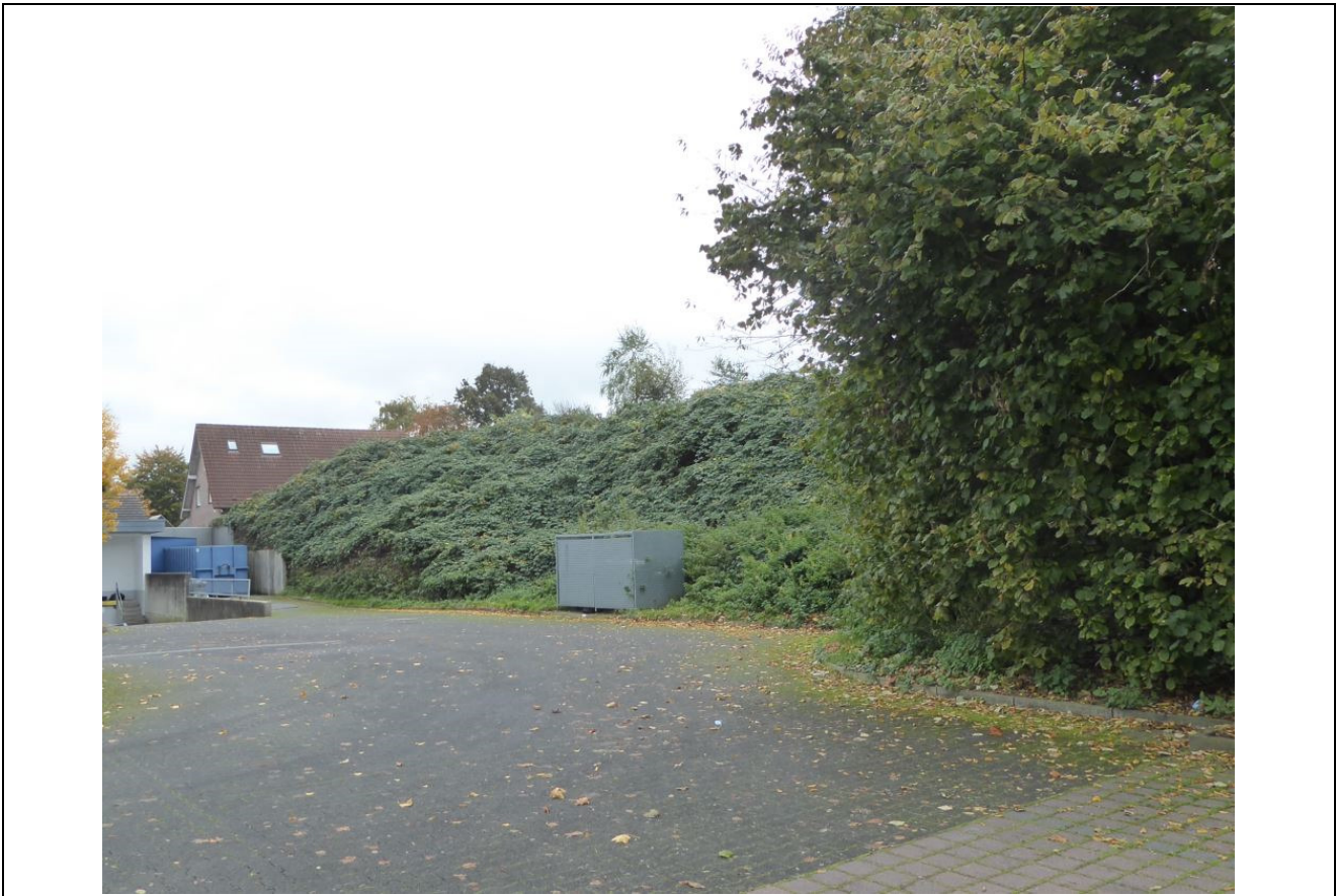
Abb. 4: Wall mit Brombeer-Bewuchs