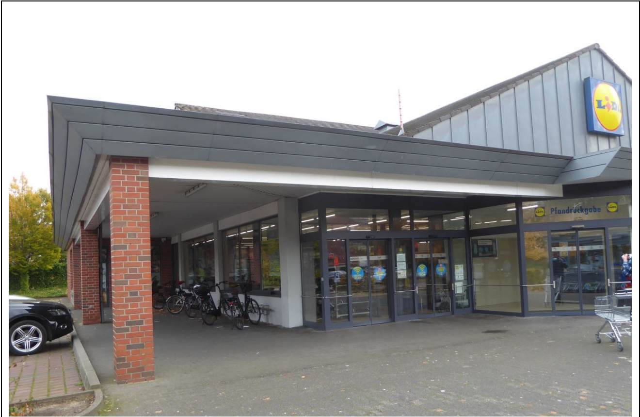
Abb. 5: geklinkerter und metallverkleideter Kontaktbereich des Lidl-Marktes

Die genaue Erweiterungsplanung ist bislang nicht bekannt.