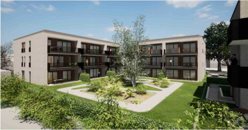
Garten Wohngemeinschaft, Gebäude A-B