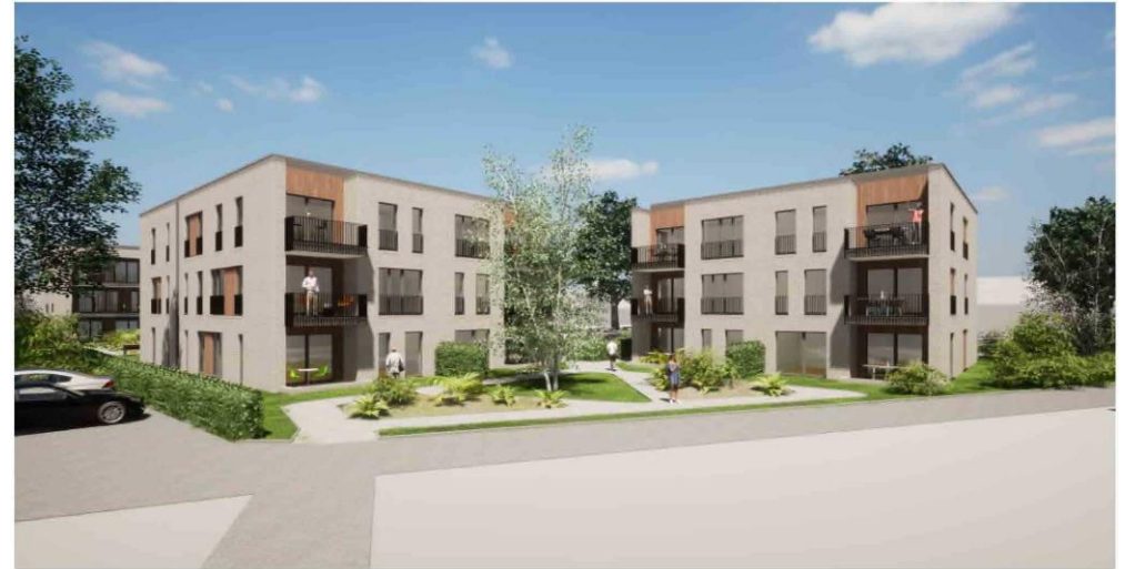
Garten Wohngemeinschaft, Gebäude C-D