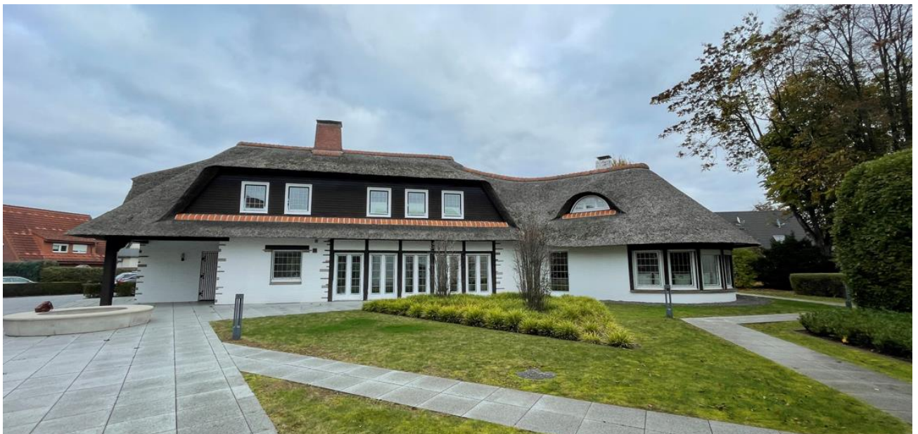
Abb. 2: Ansicht der Gartenfassade