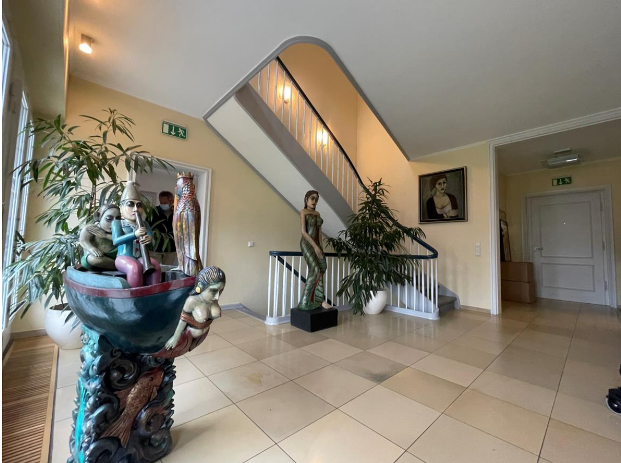
Abb. 3: Ansicht der Halle mit Solnhofner Platten (LWL-DLBW, Kuhrmann, 10/2021)

Nach der Begriffsbestimmung des nordrhein-westfälischen Denkmalschutzgesetzes § 2 Abs. 1 sind Denkmäler Sachen, Mehrheiten von Sachen und Teile von Sachen, an deren Erhaltung und Nutzung ein öffentliches Interesse besteht. Ein öffentliches Interesse besteht, wenn die Sachen bedeutend für die Geschichte des Menschen, für Städte und Siedlungen oder für die Entwicklung der Arbeits- und Produktionsverhältnisse sind und für deren Erhaltung und Nutzung künstlerische, wissenschaftliche, volkskundliche oder städtebauliche Gründe vorliegen. Gemäß diesen gesetzlichen Vorgaben bedarf es für das Vorliegen eines öffentlichen Interesses zweier kumulativ zu erfüllender Voraussetzungen: einer Bedeutung der Sache einerseits sowie eines Grundes für die Erhaltung und Nutzung andererseits.