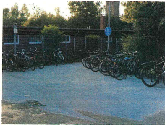
Parkplatzsituation Berkelpättchen Reiningmühle

Aus dieser Ausgangslage heraus bietet sich die Chance, die beiden Projekte nachhaltig für die sporttreibende Öffentlichkeit im Westen der Stadt miteinander zu verbinden