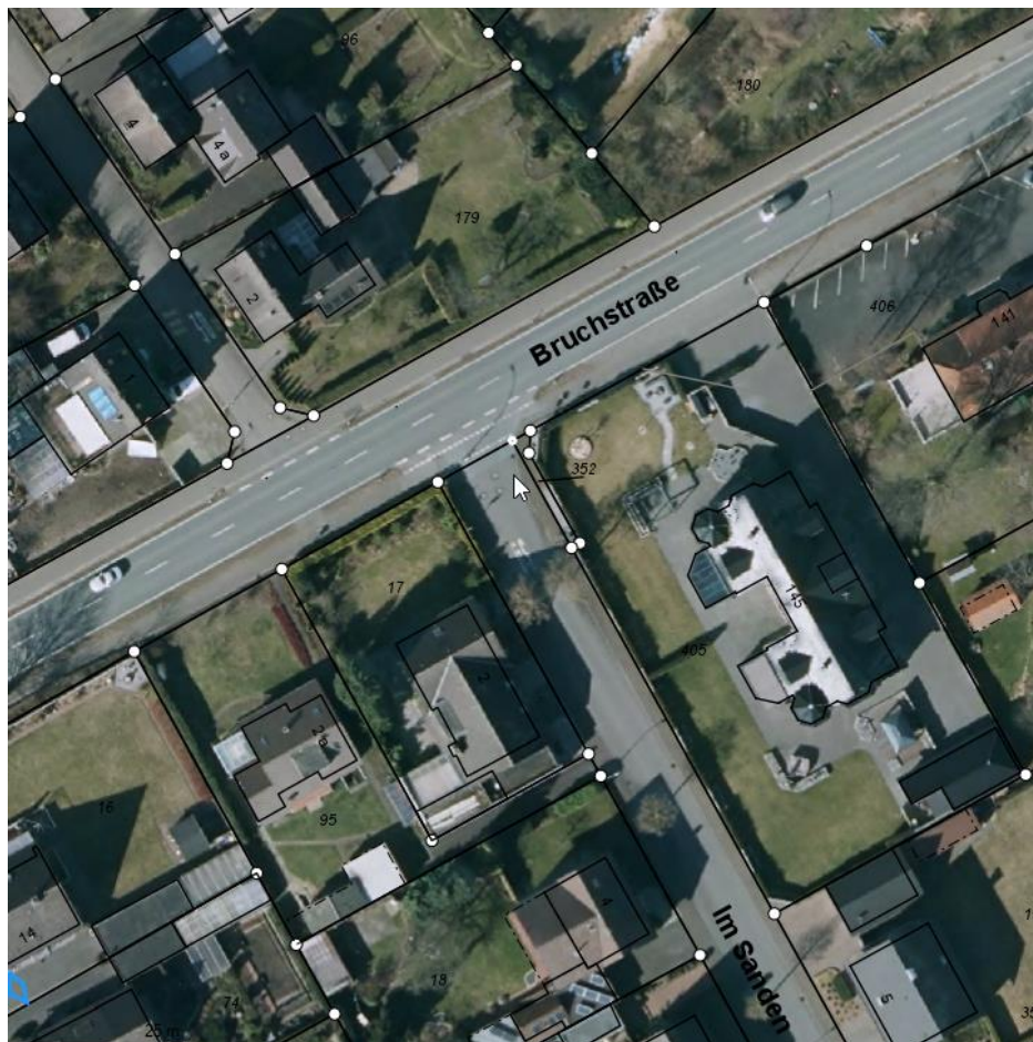
Übersichtsplan Auszug GIS der Stadt Coesfeld